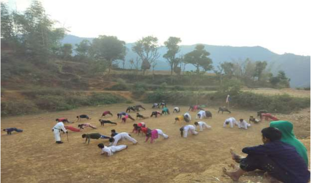
वालावालिकालाई कराते प्रशिक्षण