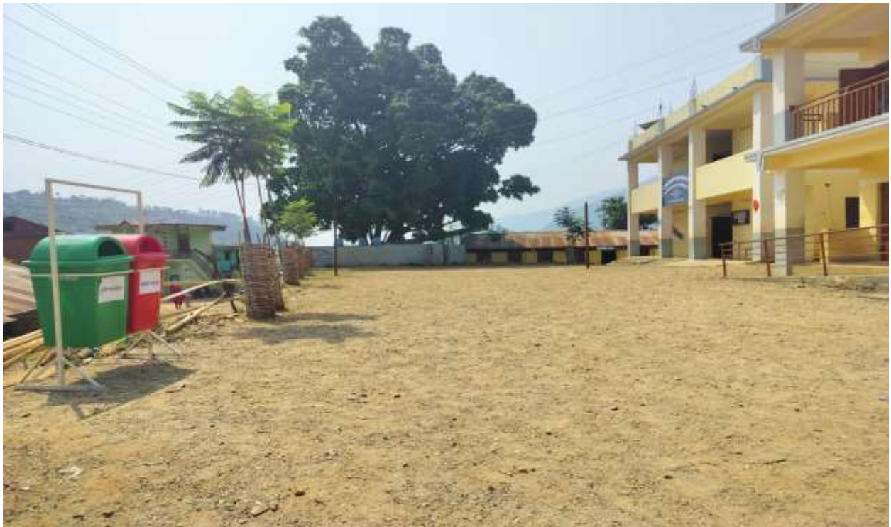
वालमैत्री धारा र खेल मैदान