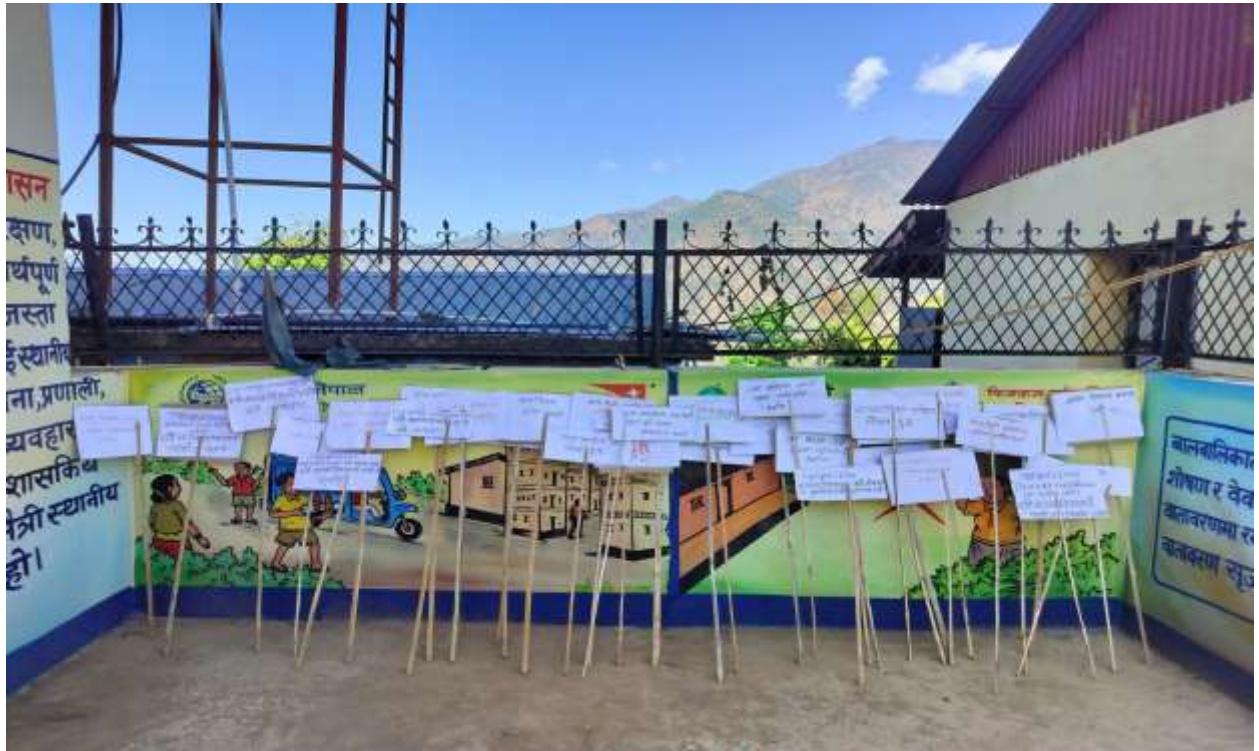
वालक्लव द्वारा आयोजित कार्यक्रम