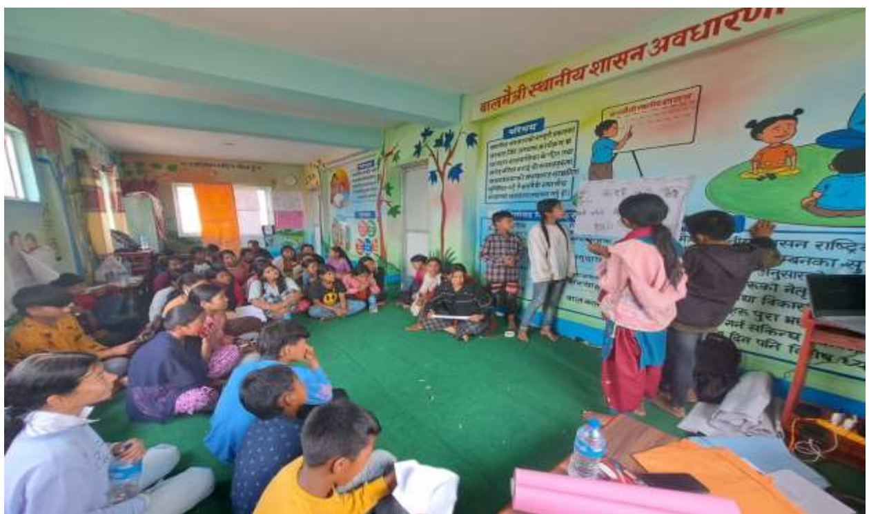
वडा कार्यालयमा भएको बालमैत्री कक्ष