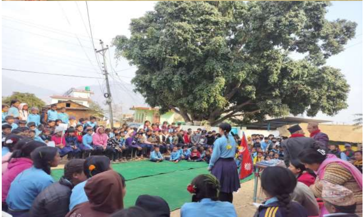
जन प्रतिनिधिलाई प्रेमपत्र