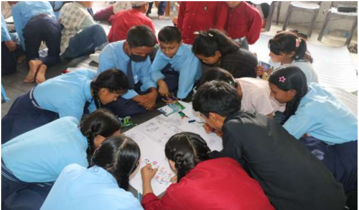
गाउँपालिका स्तरीय बाल भेला कार्यक्रम