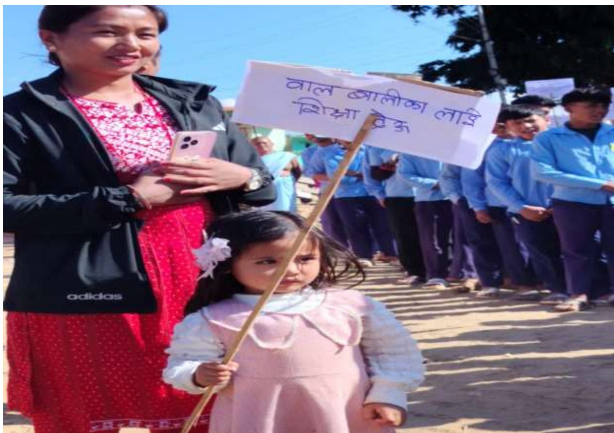
बाल श्रम तथा बालविवाह विरुद्धको जनचेतना मूलक प्रभातफेरी कार्यक्रम